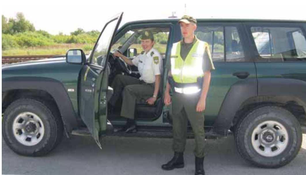
Muuga piirivalvekordeoni toimikond

Kirke Klemmer Piirivalveamet Ennetus- ja teavitusrühm